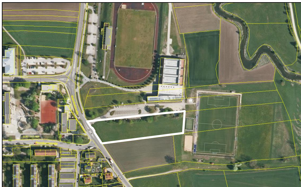
Luftbild Lage Änderungsgebiet

Westlich des überplanten Areals grenzen die Verkehrsflächen der Bahnhofstraße (Straße und Gehwege) sowie die westlich dieser liegenden Gebäude und sonstigen baulichen Anlagen und Freibereiche einer bestehenden Kindertagesstätte („Johanni-Piraten“) sowie der Grund- und Mittelschule Kissing an. Südlich befinden sich landwirtschaftlich genutzte Flächen bzw. Rasenflächen der Sport- und Freizeitanlage Kissing. Im Osten grenzen ein Kunstrasen-Spielfeld sowie Rasenflächen der Sport- und Freizeitanlage Kissing. Nördlich des Änderungsgebietes liegt der Parkplatz der Paartalhalle, die Paartalhalle und das Fußballstadion Kissing.