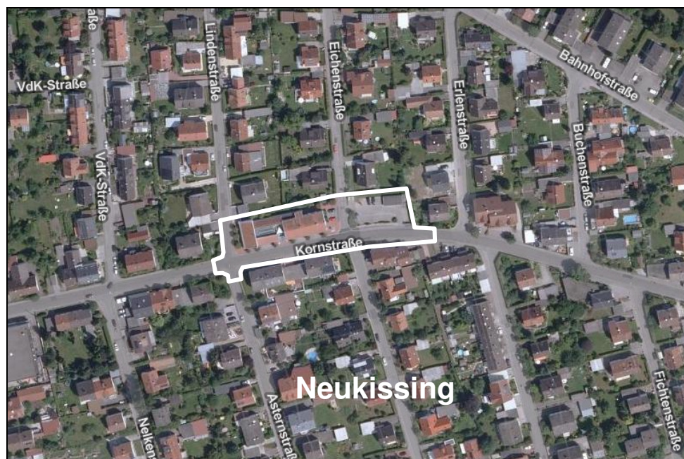
Luftbild Lage Plangebiet

Das Plangebiet des Bebauungsplanes Nr. 58 „Kornstraße/Eichenstraße“ befindet sich im Zentrum der Ortslage (Neu-)Kissing, unmittelbar nördlich der Kornstraße und wird geteilt durch die Eichenstraße (tlw. einschließlich). Es umfasst die Grundstücke Flur Nr. 3229/13 und 3229/19 sowie Teilflächen der Grundstücke Flur Nr. 3217 (Kornstraße), 3204/11 (Lindenstraße) und 3204/16 (Eichenstraße), jeweils Gemarkung Kissing.