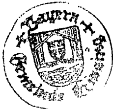
Hubert Geiger Gemeindewahlleiter

Angeschlagen am: 13.03.2019/se abgenommen am: Veröffentlicht am: (Amtsblatt, Zeitung) im