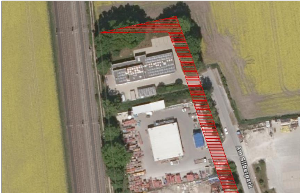
Abb. 2: Luftbild mit Abgrenzung Biotop-Nr. 7631-0013-001

0013-001, „Baumhecke nordwestlich Neukissing – naturnahe Hecke“).