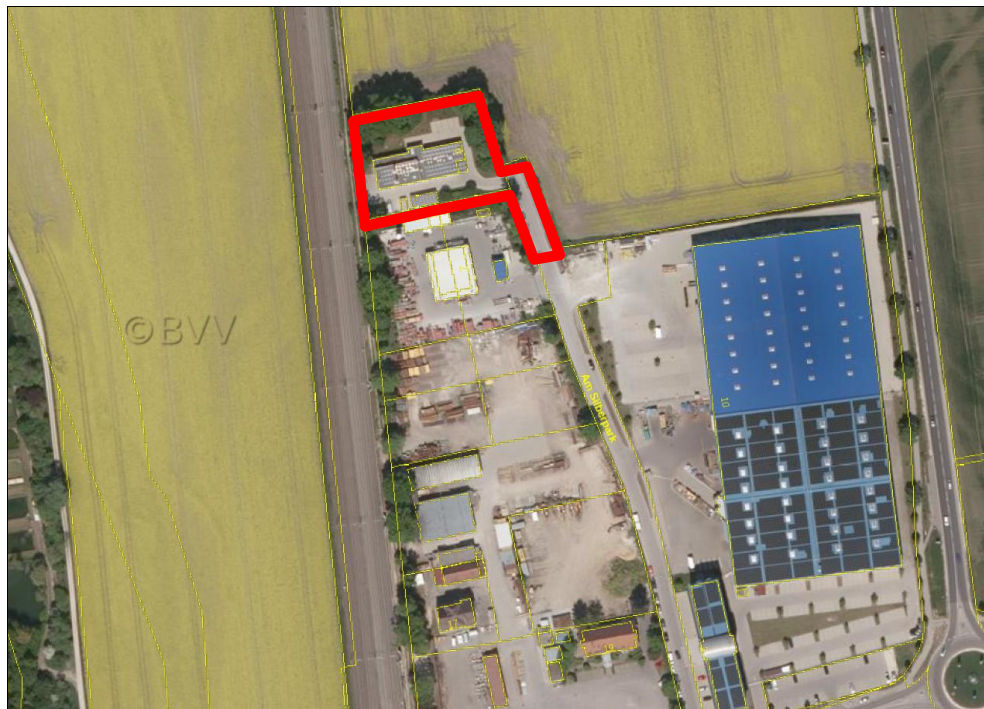
Abb. 1: Luftbild mit Änderungsbereich

Das überplante Grundstück Fl.Nr. 3502/3, Gemarkung Kissing, befindet sich im Eigentum des Gewerbetreibenden. Bei dem teilweise überplanten Grundstück Fl.Nr. 3418/3, Gemarkung Kissing, handelt es sich um eine Teilfläche der öffentlich gewidmeten Verkehrsfläche der Straße „Am Silberpark“. Diese Flächen liegen im Eigentum der Gemeinde Kissing.