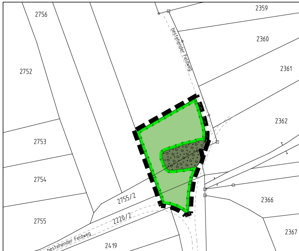
Abb. 3: Auszug Teilplan 2 zur rechtsverbindlichen 3. Änderung des Bebauungsplanes Nr. 17

„Entwicklung standortgerechter Hecken in Verbindung mit artenreichen Saumstrukturen bzw. Wiesenflächen“) wurden der rechtsverbindlichen 3. Änderung des Bebauungsplanes Nr. 17 auch bereits planungsrechtlich zugeordnet und damit auch entsprechend gesichert. Die Maßnahmen auf diesen Flächen wurden mit Rechtskraft der 3. Änderung des Bebauungsplanes Nr. 17 auch umgesetzt.